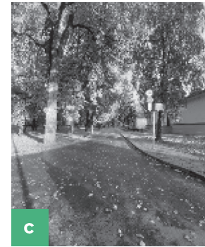
6 pav. a) geometrinė želdyno forma Sapiegų parko makete. 2019.; b) barokinis Sapiegų parkas su dezintegruotais rūmais. 2019.; c) Sapiegų parkas su inžinerinės infrastruktūros svetimybėmis. 2019

formuoja ydingą praktiką abejoti ekspertine kompetencija. Dar daugiau - taip paneigiama parko meninės idėjos nekintamumo, interpretacinio meno ir istorinio fenomeno išlikimo problema, net ignoruojama Sapiegų rūmų istorinė būtis.