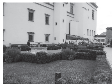
2 pav. a) Lietuvos didžiųjų kunigaikščių rūmų plano schema; b) ir c) XVI a. vid. Lietuvos didžiųjų kunigaikščių rūmai su atkurto renesansiniu sodeliu