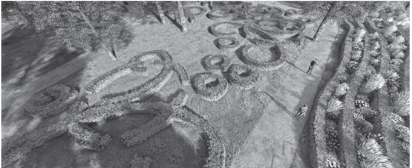
4 pav. Barokinio Sapiegų parko idėjos atkūrimo interpretacija