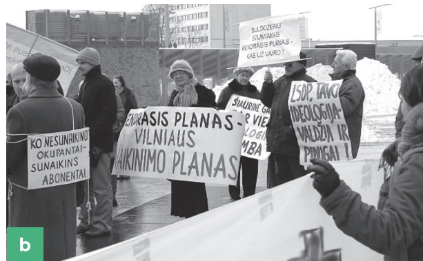
5 pav. a) 2019 m. neteisėtų statybų panaikinimas ir „pavogtų“ viešųjų erdvių grąžinimo visuomenei procesas (Griauti neteisėtai pastatytą pastatą Lietuvos Aukščiausiasis Teismas nurodė dar 2017 metais - autoriaus pastaba); b) visuomenės aktyvumas sprendžiant teritorinių (vietos) bendruomenių problemas Vilniuje: „Daugumos nuomonė visada privaloma visiems kitiems“ (Rousseau 1979). To pagrindas - laisvai priimti įsipareigojimai, kuriuos pripažįsta visa gerovės siekianti visuomenė.

vietos lygmeniu 17 . Vienas tokių pagrindų įgyvendinant aplinkosauginę demokratiją yra Orhuso konvencija (Orhuso konvencija... 2018). Tačiau tai, kad Orhuso konvencijos teisių įgyvendinimas vis dar ES problema, rodo 2018 m. Europos Vadovų Tarybos kreipimasis į Komisiją dėl iki 2019 m. rugsėjo 30 d. privalomumo pateikti Orhuso konvencijos ES valstybėse įgyvendinimo tyrimą. Ypač aktualios sritys dėl teisės užtikrinimo gauti informaciją, visuomenės dalyvavimo priimant sprendimus ir teisės kreiptis į teismus aplinkosaugos klausimais ir kaip ES valstybės narės yra įsipareigojusios laikytis konvencijos ir siekti jos tikslų įgyvendinimo.