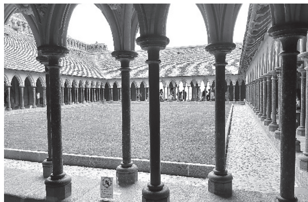
1 pav. Saint Michel (Prancūzija) vienuolyno viduramžių sodas kaip taikomojo meno, utilitariems tikslams skirtas ribotos prieigos objektas