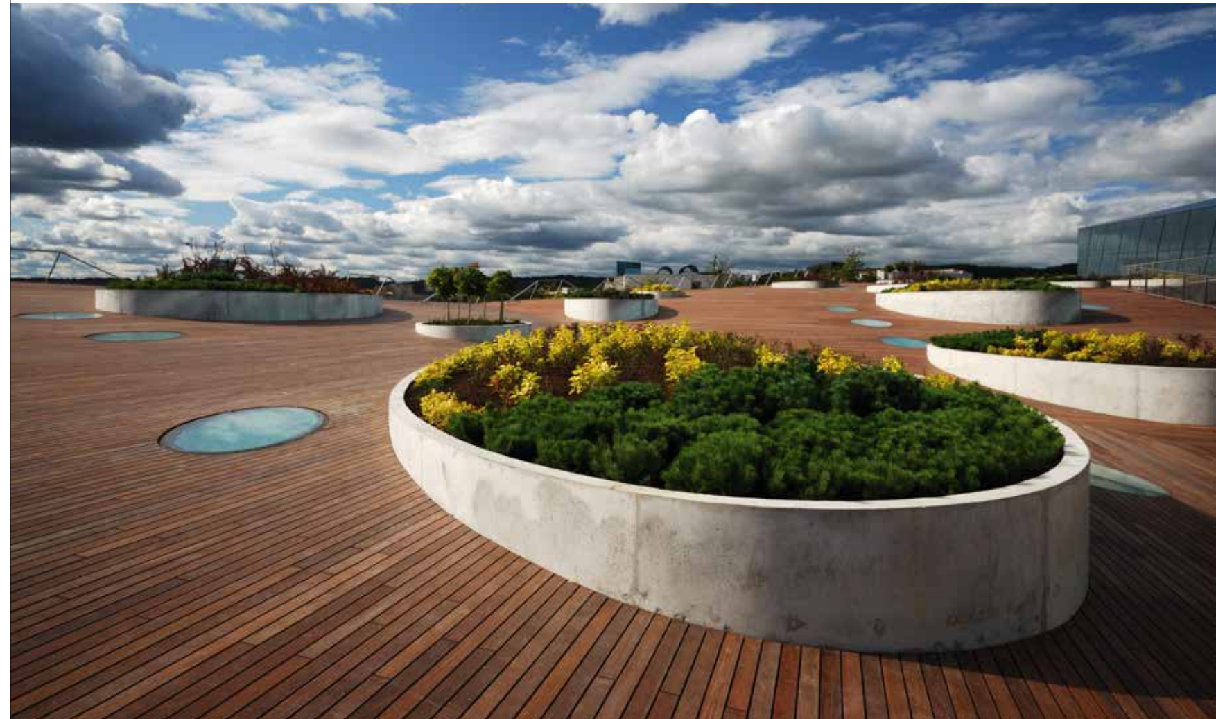
„Swedbank“ centrinė būstinė Vilniuje, 2009. Architektai – Audrius Ambrasas, Vilma Adomonytė, Tomas Eidukevičius, Donatas Malinauskas.

Pastarasis metas – pandemija, karas – atskleidė, jog Europoje stinga lyderių. Regis, buvo susiformavęs požiūris, kad ryškūs lyderiai yra blogis, jie nereikalingi, bet atsidūrus kritinėse situacijose paaikškėjo, jog nelabai yra kam priimti sprendimus. Kažkuria prasme didelių projektų įgyvendinimo procesą irgi galima lyginti su katastrofa.