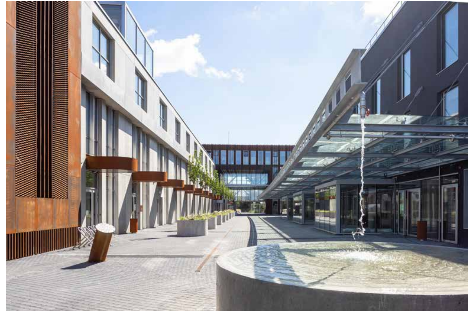
Versto namai PAUPYS Vilniuje, 2020. Architektai – Audrius Ambrasas, Rasa Ambrasienė, Jonas Motiejūnas, Justas Jankauskas.

Sakoma, kad daržoves sveikiausia valgyti tas, kurios užaugintos ne didesniu nei 300 kilometrų spinduliu nuo tavęs. Su architektūra turbūt irgi panašiai – geriausia ją kurti ir vartoti