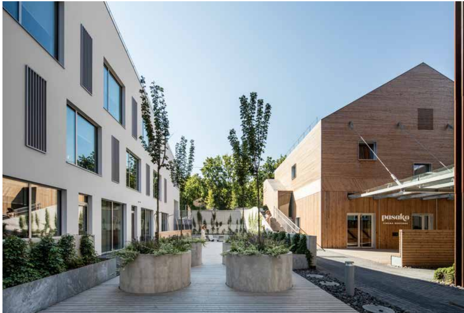
Versto namai PAUPYS Vilniuje, 2020. Architektai – Audrius Ambrasas, Rasa Ambrasienė, Jonas Motiejūnas, Justas Jankauskas.

gimsta daugybės ingredientų mišinyje. Jeigu „chemija“ gera, randasi ir gera mintis. Tačiau net ir statybos metu iki tam tikro momento kamuojama nerimas, ar pavyks. Palengvėjimas ateina tuomet, kai galiausiai topteli mintis, kad gal vis tik bus gerai.