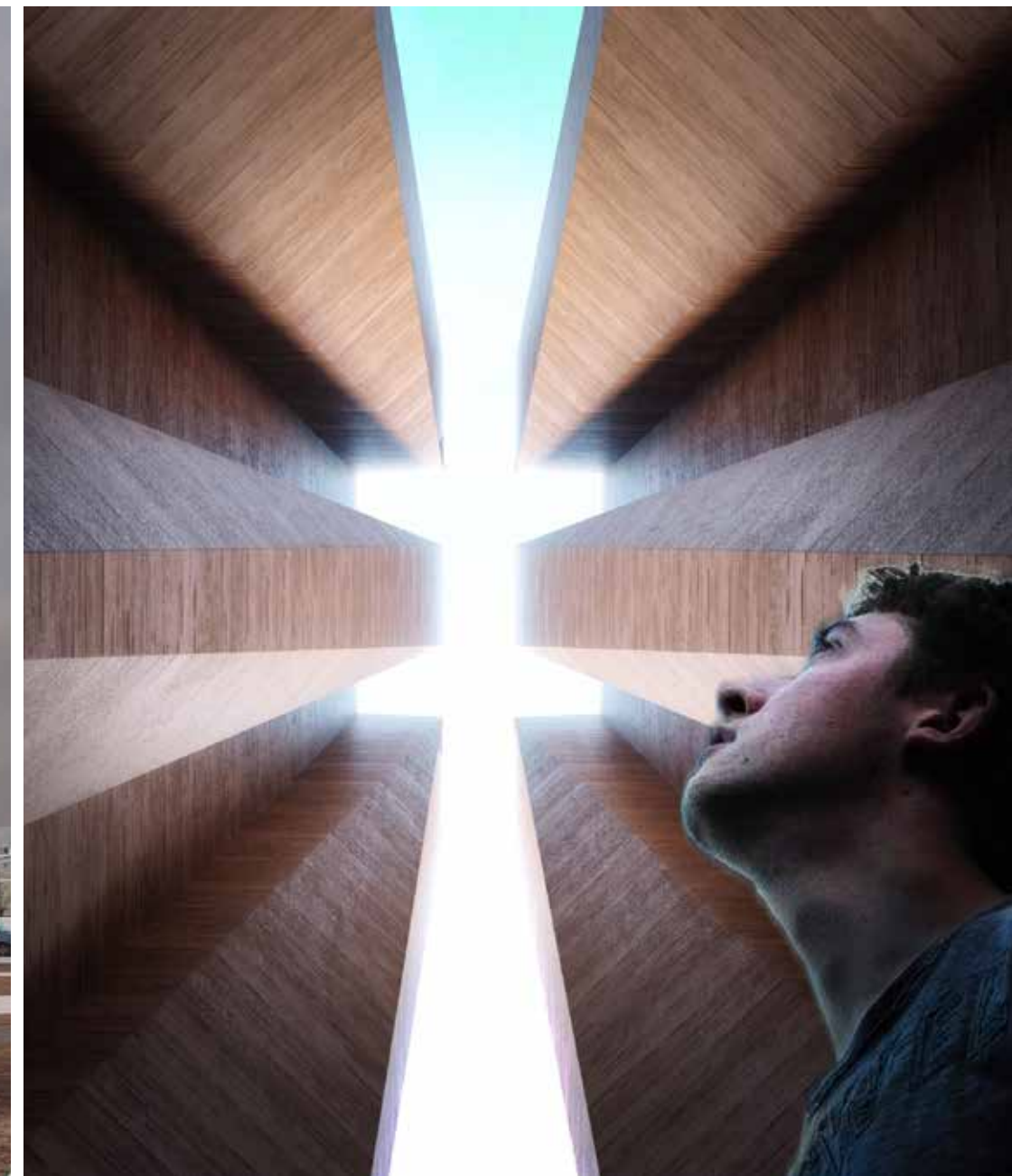
Paminklo Aukų gatvės skvere Vilniuje idėja, 2017. Justo Jankausko vizualizacijos