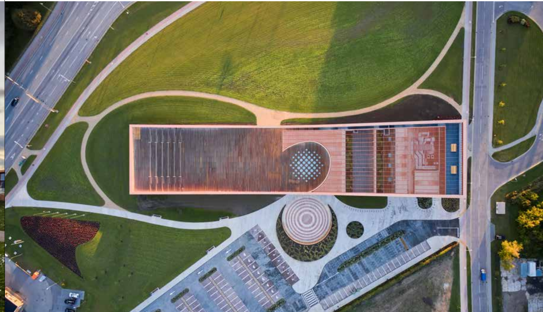
Mokslų ir inovacijų centras VIZIUM Ventspilyje, 2022. Architektai – Audrius Ambrasas, Vilma Adomonytė, Jonas Motiejūnas, Viktorija Rimkutė, Justas Jankauskas

viešojoje erdvėje, ir architektams tenka su tuo susitaikyti.