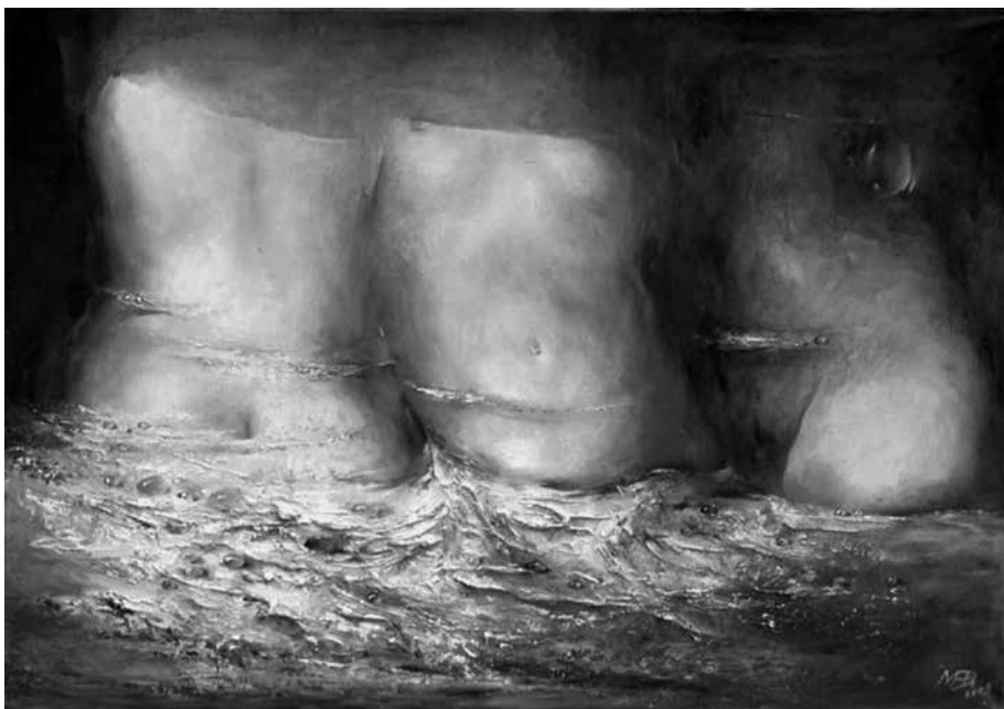
M. NORBUTAITĖ. Bridimas , 2003. Drobė, aliejus, 65 × 92