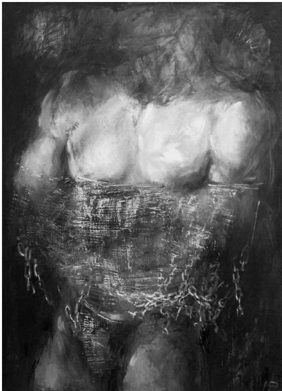
M. NORBUTAITĒ. Karys , 2001–2002. Drobē, aliejus, 100 × 73