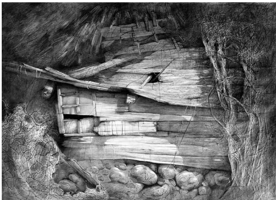
M. NORBUTAITĖ. Atminimas , 2001. Popierius, grafitas, autorinė technika, 66 × 97