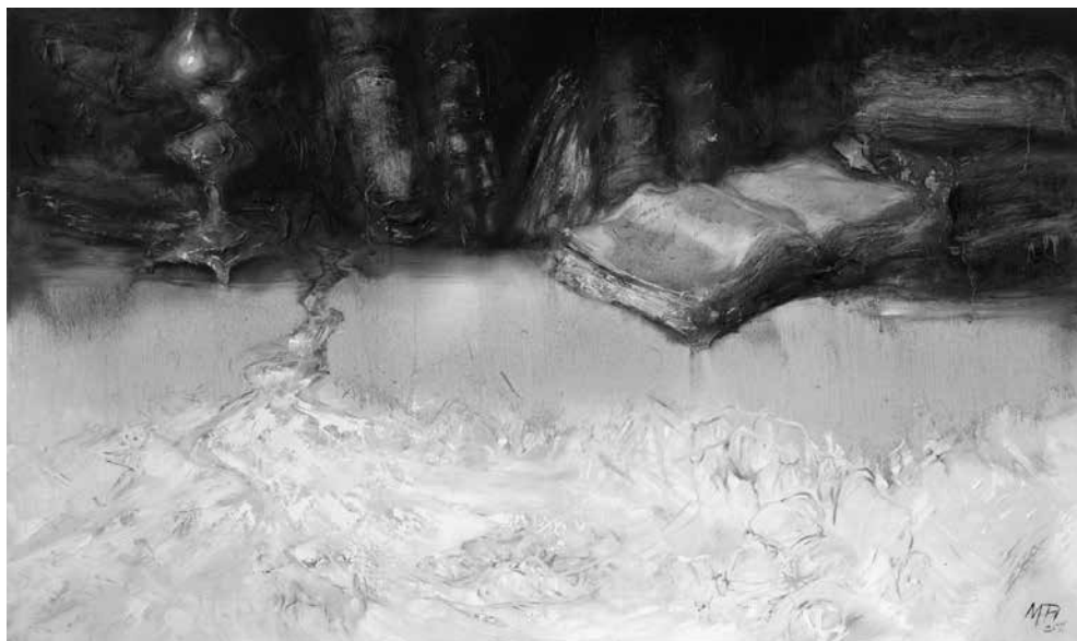
M. NORBUTAITĖ. Minčių raštai , 2011. Drobė, aliejus, 90 × 150