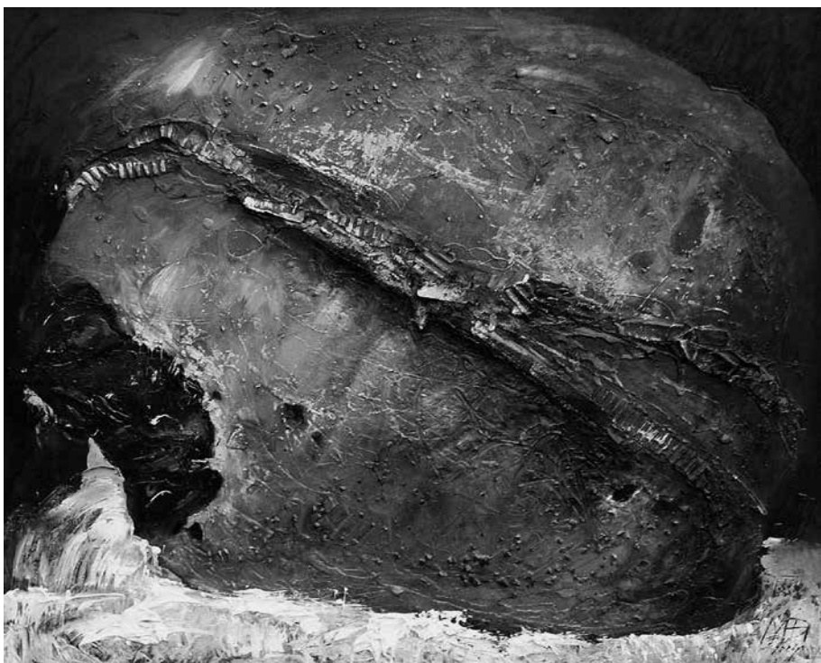
M. NORBUTAITĖ. Rubinų duona , 2004. Kartonas, aliejus, koliažas, 54 × 66