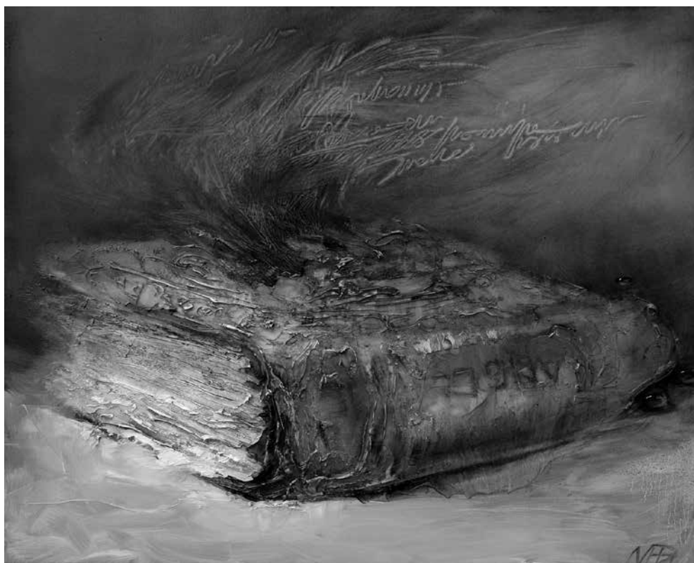
M. NORBUTAITĖ. Giesmė , 2012. Drobė, aliejus, akrilas, 70 × 85