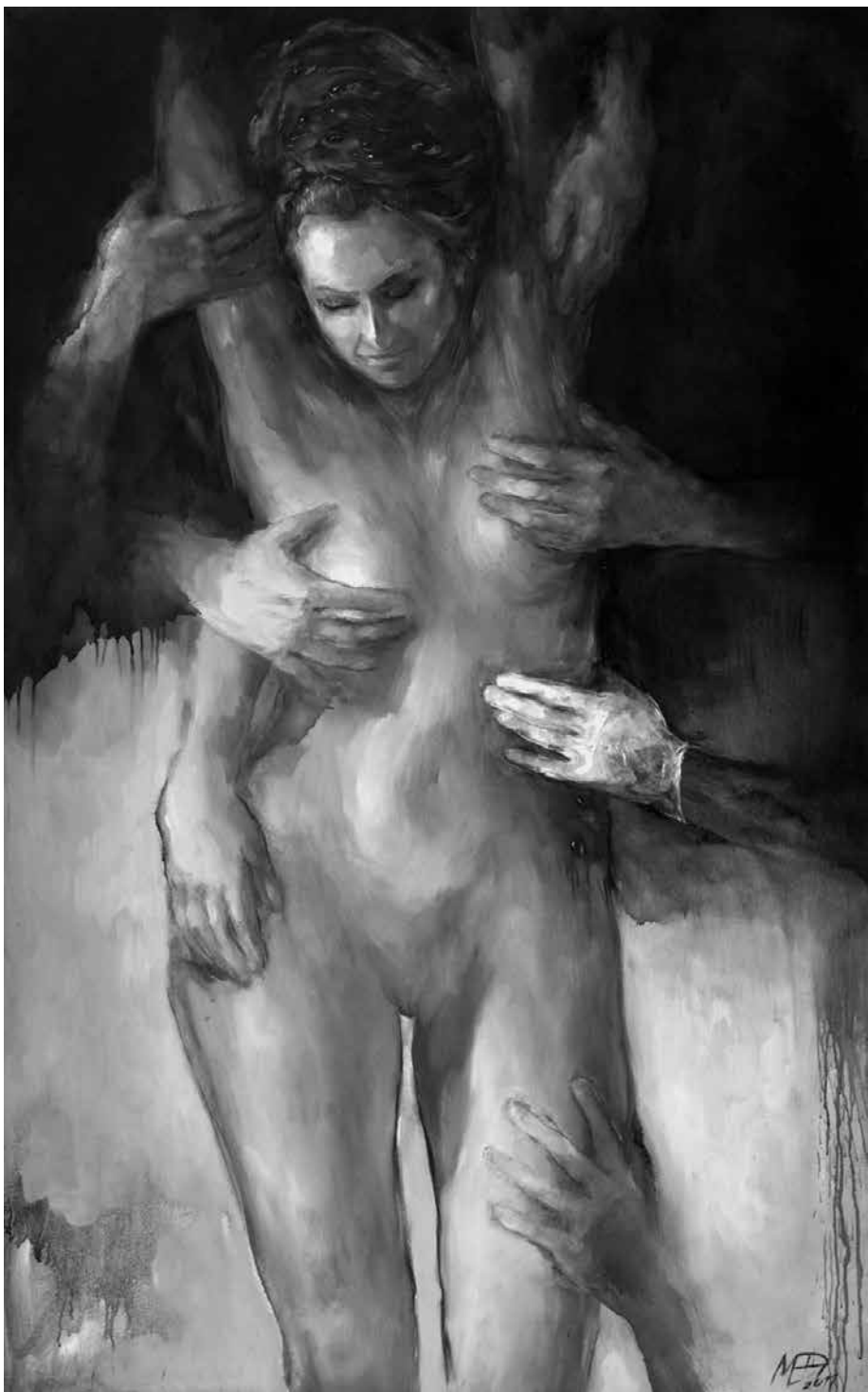
M. NORBUTAITĖ. Sculptorių rankose , 2013. Drobė, aliejus, akrilas, 150 × 90