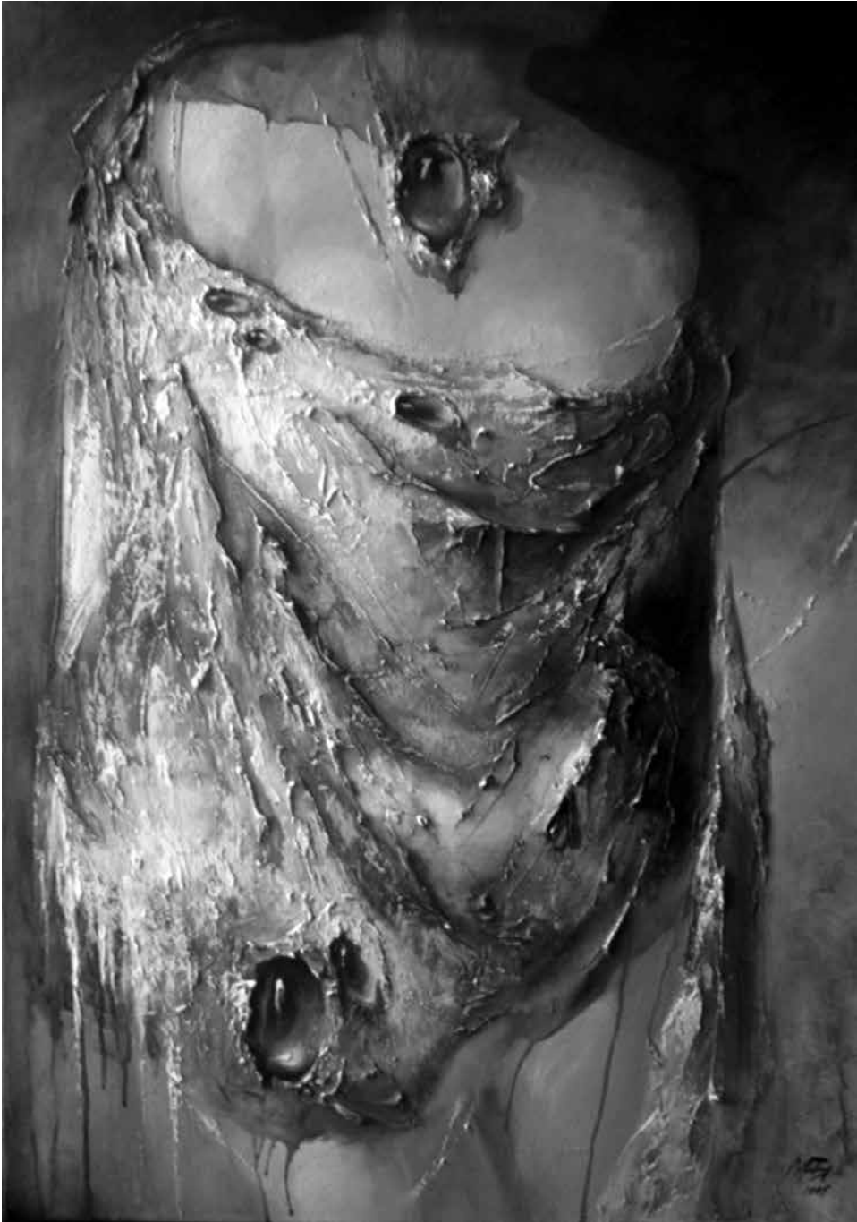
M. NORBUTAITĖ. Jausena , 2006. Drobė, aliejus, akrilas