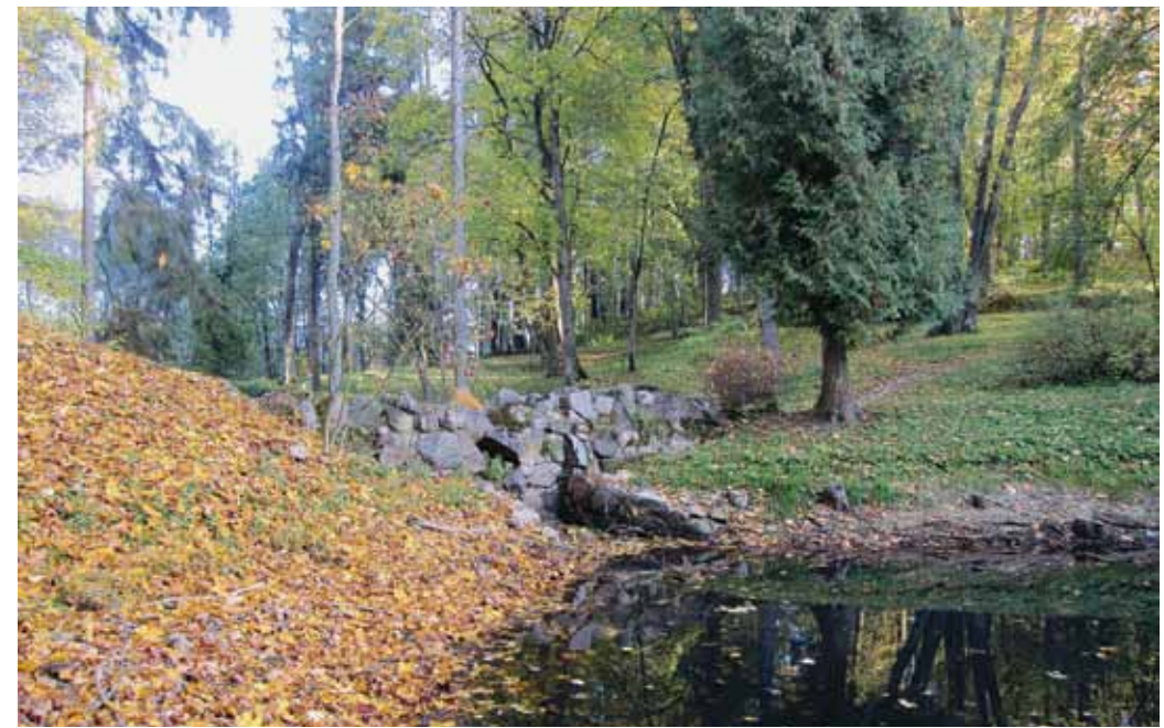
1. Charakteringas Lentvario sodybos parko fragmentas, 2016 spalvis

5 Taip galima teigti susipažinus su traktato (Édouard François André, L'art des jardins: Traite general de la composition des parcs et jardins , Paris: G. Masson, 1879) fragmentais