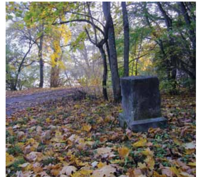
9. Postamentas, Vytauto Petrušonio nuotrauka, 2016 spalvis

Largest waterfall in the park, October 2010