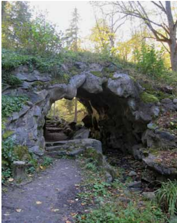
7. Tiltas-viadukas su grotu, 2016 spalvis

Bridge-overpass with a grotto, October 2016