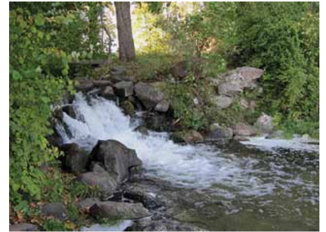
8. Didžiausias parko krioklys, Vytauto Petrušonio nuotrauka, 2010 spalvis

Largest waterfall in the park, October 2010