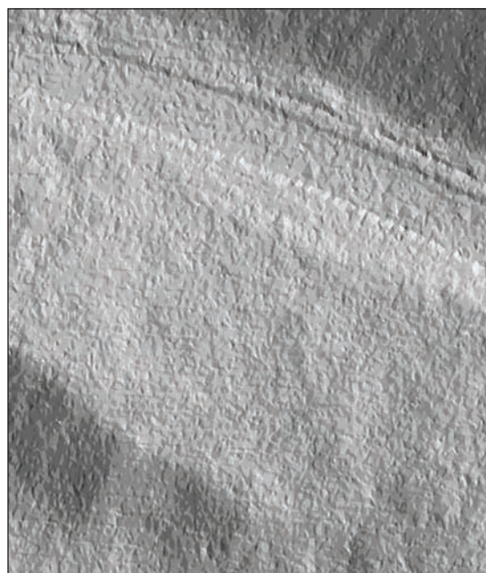
1 pav. Eksperimentinė teritorija

Eksperimentui parinkta Vilniaus teritorija šalia Baltojo tilto (1 pav.). Teritorijos reljefas apibūdinamas kaip tolydus. Teritorijoje yra neaukštas ir nestatus šlaitas, kelias su asfalto danga ir apvadais, šaligatviai. Vidutinis kelio apvadų aukštis – 0,10–0,22 m. Teritorijoje – 515 000 LIDAR skenuojant išmatuoti Žemės taškai, taškų aukščiai 86,34–103,43 m. Vidutinis taškų tankis – 2,3 tšk./m 2 , mikronelygumai – <0,05 m.