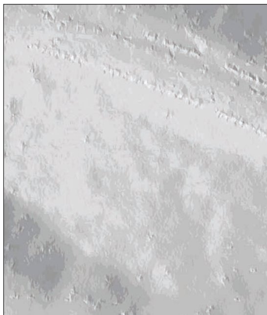
2 pav. Paviršius, sukurtas taikant glodinimo parametrus +/-0,05 m/0,09 m

Matyti, kad horizontalės, sukurtos naudojant etaloninį paviršių, turi daug nelygumų. Naudojant nedideles glodinimo funkcijos parametru reikšmes – apie 0,10 m, glodinimo įtaka konstruojant paviršių minimali. Išlaikoma informacija apie dangų apvadus ir didesnius aukščių reikšmių skirtumus turinčius vietovės objektus, bet išlyginami mikronelygumai.