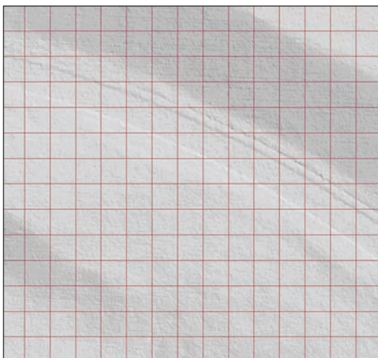
5 pav. Tiriamosios teritorijos skaidymas 10 m tinkleliu

Fig. 5. Division of the tested area into 10 m grid