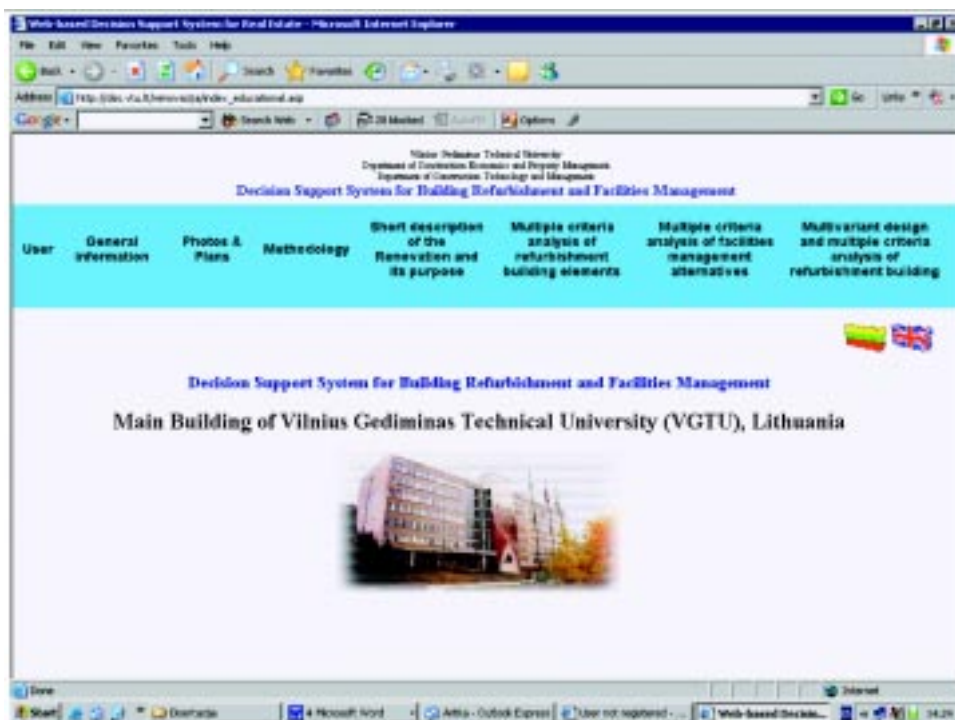
1 pav. Pastatų atnaujinimo žiniomis grįsta sprendimų paramos sistema

PR-SPS sudaryta iš duomenų bazės ir duomenų bazės valdymo sistemos, modelių bazės ir modelių bazės valdymo sistemos, vartotojo sąsajos (2 pav.).