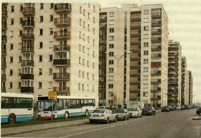
Bene labiausiai žaliosios erdvės sostinėje trūksta Perkūnkiemio kvartale.

Kiek šiuo metu VGTU ar kitoje aukštojoje mokykloje studijuoja būsimųjų kraštovaizdžio architektų? Atsakymas nustebina. „Šiuo metu – nulis. Prieš du dešimtmečius kraštovaizdžio architektus rengė Vilniaus dailės akademija, prieš penkerius metus – Klaipėdos universitetas, tačiau dėl įvairių priežasčių ši specialybė nunyko. Visgi vilčių yra: VGTU parengė naują – kraštovaizdžio architektūros – studijų programą, ir iki naujų mokslo metų tikimasi ją paleisti į gyvenimą. Jaunieji specialistai yra būtini, kad perimtų patirtį iš tų, kurie šioje srityje pradėjo dirbti dar sovietmečiu, kad matytų klaidas, mokytųsi iš jų ir rastų savo kelius“, – įsitikinęs profesorius.