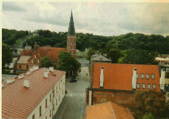
Kaunas žaliaisiais plotais gali girtis labiau negu sostinė.

„Svarstant konkrečius naujų miestų kvartalus ar pastatų ir gamtinių sąlygų dermės projektus, visada kyla nesutarimų, atsiranda nepatenkintų piliečių. Ir tai – normalu, nes per 50 sovietmečio metų tokių diskusijų su visuome- ne nebūta apskritai. O bemaž tris dešimtmečius nepriklausomybė