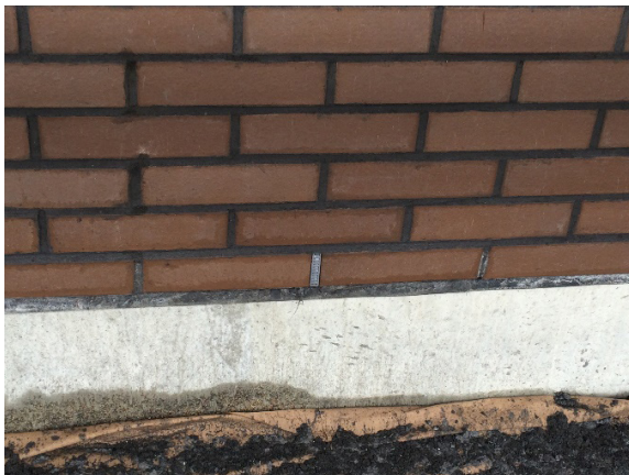
1 paveikslas. Apdailos mūras atremtas į pamatą Figure 1. Cavity wall support on the foundation

Apdailos plytų gamintojai siūlo platų šiuolaikišką plytų asortimentą, kuris pastato fasadui suteikia prabangią išvaizdą. Trisluoksniai apdailos plytų fasadai yra ilgamžiškesni, lengviau remontuojami ir užtikrina geresnę garso bei šilumos izoliaciją. Tokie fasadai yra nelakančioji konstrukcija, atremta į pamatą (1 pav.) arba pakabinta ant pastato laikančiojo karkaso (2 pav.). Trisluoksniai apdailos plytų fasadai įrengiami visuomeniniuose