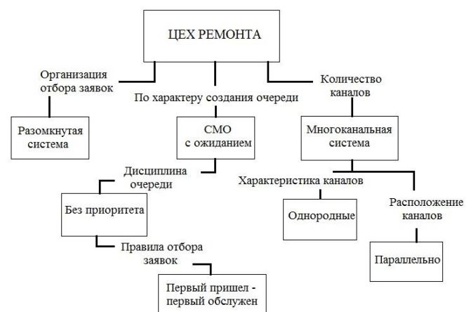
Рис. 1. Цех ремонта как система массового обслуживания

Граф состояний цеха ремонта с ремонтными позициями n и местами в очереди m показан на рисунке 2. Он представляет собой схему гибели и размножения, для которой решение в общем виде уже получено.